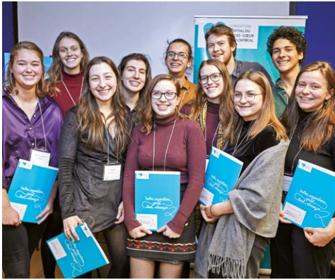
Les boursiers du cégep de Saint-Laurent